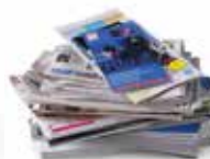
Papier (enveloppes, feuilles...), journaux, prospectus, magazines

“ LES SACS TRANSPARENTS SONT DISPONIBLES GRATUITEMENT EN MAIRIE ET AU SIRTOM ”