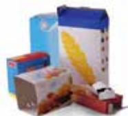
Cartons, briques alimentaires