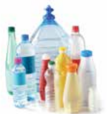
Bouteilles et flacons en plastique