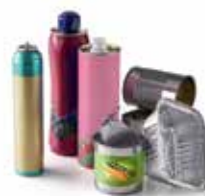
Emballages métalliques (barquettes en aluminium, aérosols...)