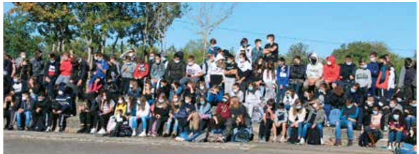
Une partie des élèves lors de la rentrée de septembre 2020, placée sous le signe du protocole sanitaire. L'effectif est globalement proche de 300 collégiens, la Segpa a disparu. Joliot-Curie accueillait 600 élèves en 1972.

avant de prendre sa retraite en décembre. Pendant quatre ans, l'établissement fonctionne sous le régime d'une régie municipale et intercommunale avec la création d'un syndicat scolaire. Nationalisé en 1976, il passe sous la compétence du département.