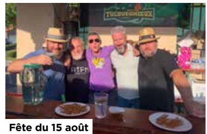
Fête du 15 août

Le BCT est également une association reconnue dans le village pour sa participation aux événements estivaux (Fête nationale du 13 et 14 Juillet, fête du 15 Août).