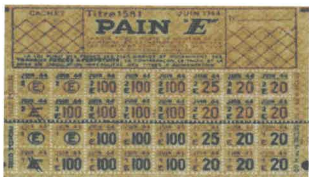
Carte de rationnement PAIN - Juin 1944