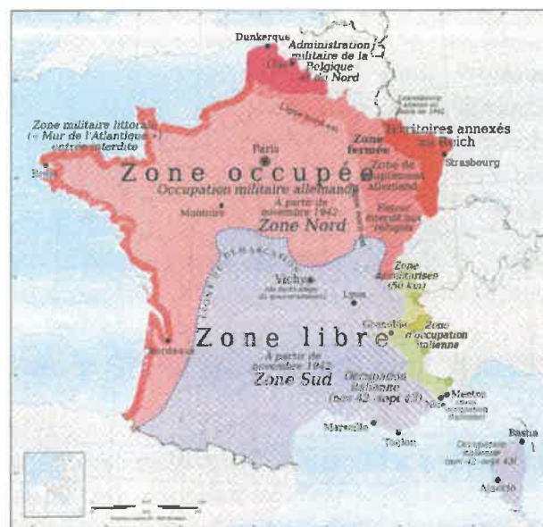
Carte de France avant le 10 novembre 1942

du Maire. Il est vrai que le contexte est particulier. Moins d'un mois auparavant, le 10 novembre 1942, les armées allemandes et italiennes ont envahi la zone libre, réduisant les derniers pans de souveraineté de l'Etat français sur le territoire.