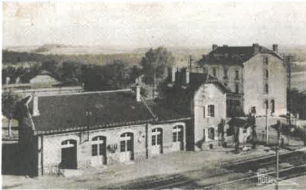
La Gare de Tucquegnieux et ses 2 voies

Il défend aussi le désenclavement de son territoire par le développement d'axes de communication : le 20 août 1941, le conseil municipal adopte ainsi un vœu réclamant l'amélioration des relations ferroviaires sur le parcours Briey - Audun Le Roman. L'insuffisance des liaisons occasionnent pour les usagers des inconvénients sérieux qui se traduisent par un gaspillage de temps et des frais excessifs, rendant parfois même impossibles des déplacements d'une urgence signalée.